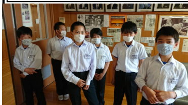
新しいパフォーマンス大会を提案する広報委員会のみなさん