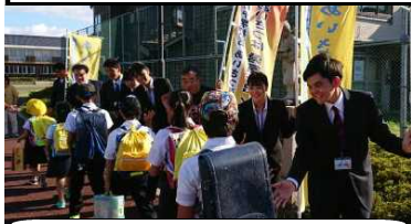
大人のあいさつ隊に参加した明星大学の学生たち