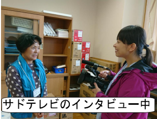
サドテレビのインタビュー中